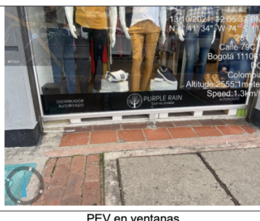
PEV en ventanas