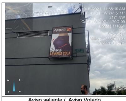
Aviso saliente / Aviso Volado